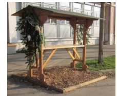
Beispiel. Übergabe erfolgt ohne Dekoration!

Der Grundrahmen des Unterstandes beträgt ca. 2,5m x 2,5m. Die Hackschnitzel in diesem Rahmen werden vom Kulturamt gestellt und sind in der Miete enthalten.